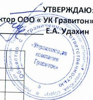
График механизированной уборки придомовой территории февраль 2024г.